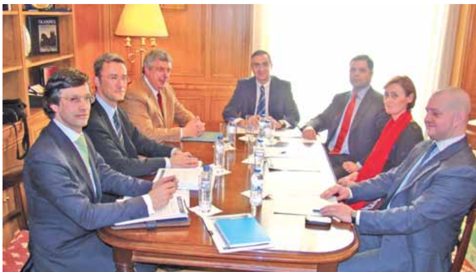
O Secretário de Estado reunido com a direcção da ATAM

Quanto à mobilidade intercarreiras dos titulares de