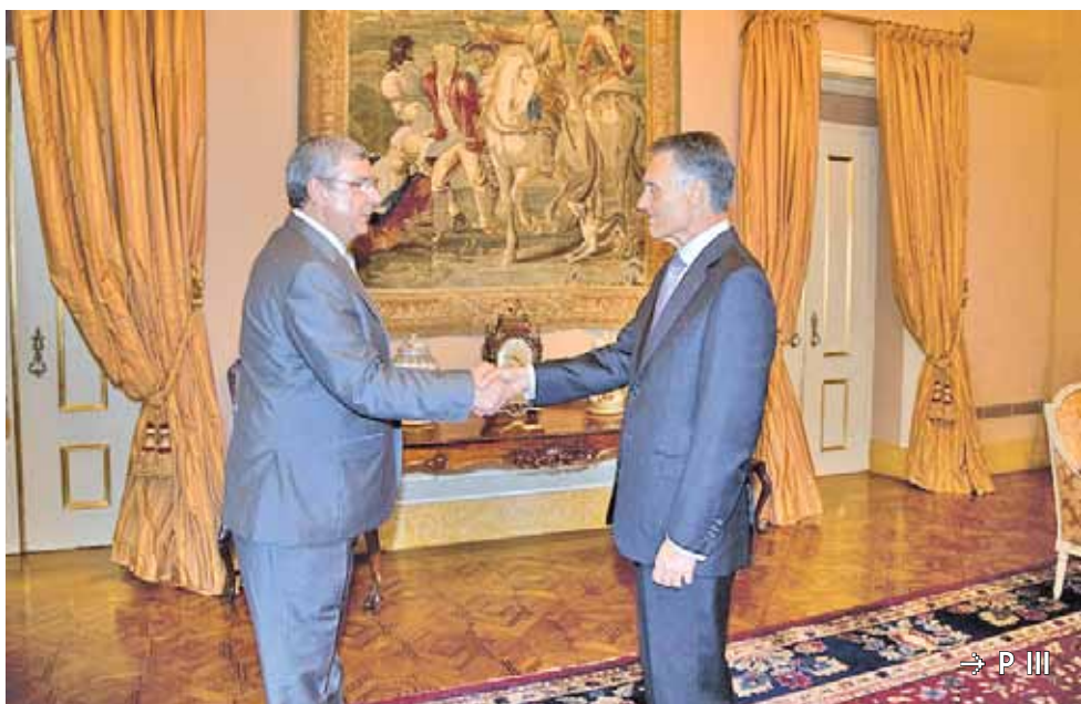
→ P III